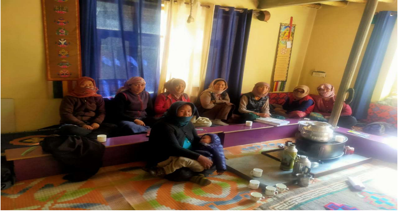
मेंतोक स्वयं सहायता समूह फोटो